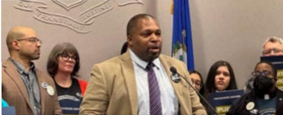
El senador Gary Winfield se dirige a la multitud con una historia conmovedora sobre la El impacto que la maestra tuvo en su hijo antes de su prematura muerte.

Obstáculos, presiones para la adopción de políticas que garanticen una compensación justa por trabajadores del servicio público y financiación adecuada para programas críticos. Con el apoyo de los jubilados y Aliados, el sindicato se compromete a luchando por un presupuesto que realmente sirve a la gente de Connecticut.