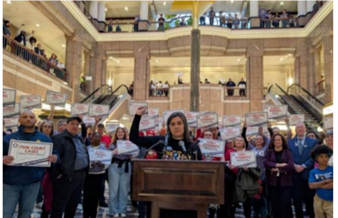
Seiscientos miembros del sindicato estatal llenaron el vestíbulo del Edificio de Oficinas Legislativas para exigir contratos justos. Pocos días después, todas las unidades de CSEA alcanzaron un Acuerdo Preliminar.

a lo que nos enfrentamos. Pista: va a suceder Será una lucha y te necesitaremos.